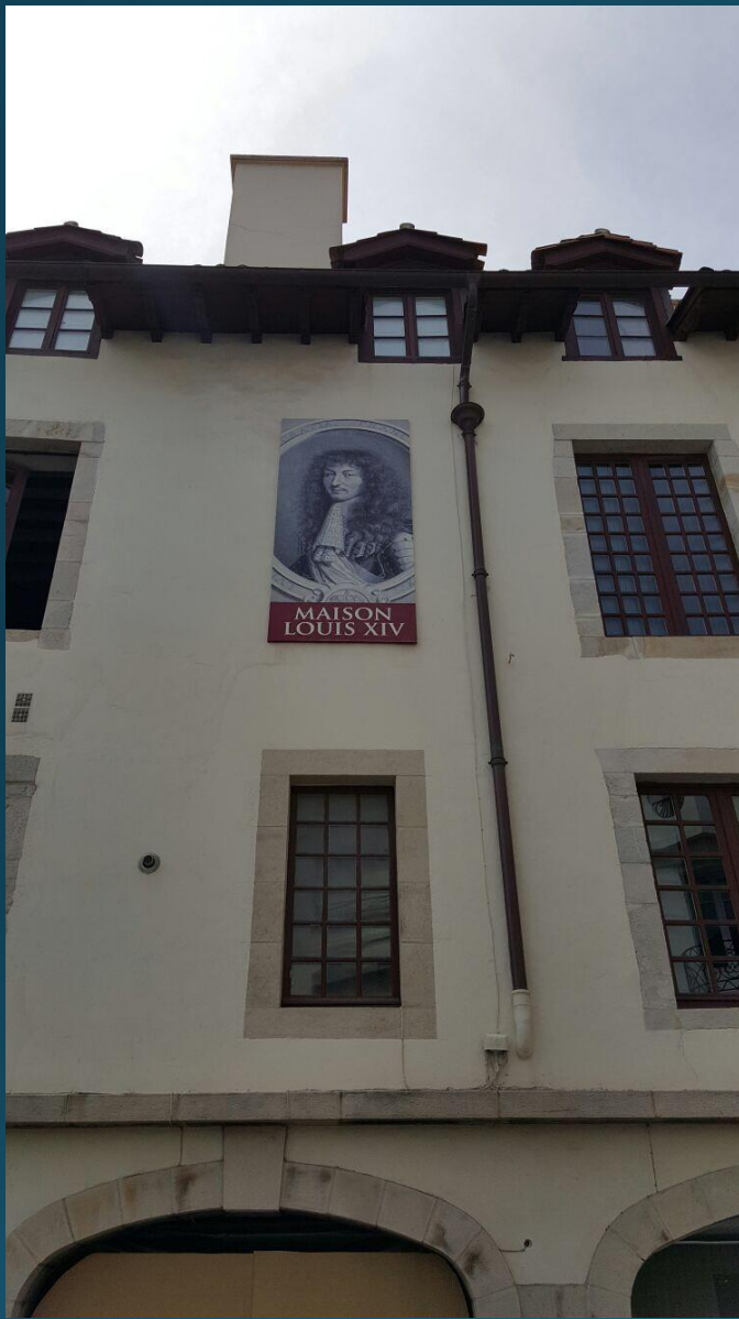
La Maison Louis XIV, un notable palacio construido en 1643 por el armador Lohobiague y que recibe su nombre porque en él se alojó este monarca durante los preparativos de su boda.