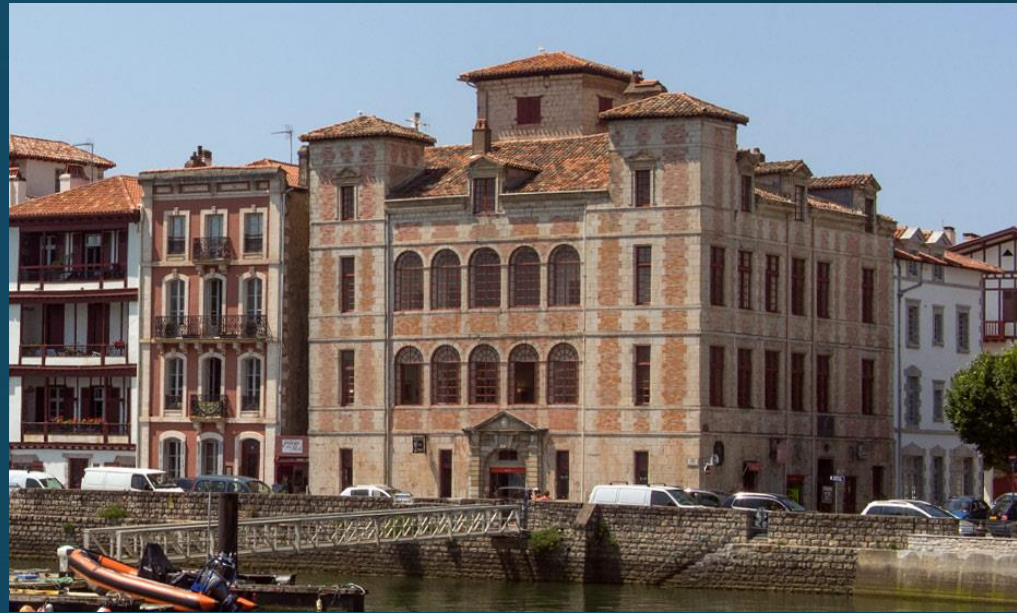
La Maison de l'Infante, un bello edificio renacentista de color rosa y de estilo italiano, que albergó a la infanta de Castilla en las jornadas previas a su matrimonio.